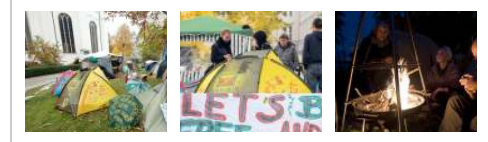
Proteste der "Occupy"-Bewegung in Berlin